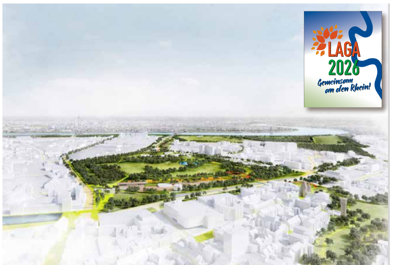
Das geplante Gelände der Landesgartenschau mit dem Rennbahnpark, der zu einem Bürgerpark werden soll.

Der „Unterstützerverein“ wurde bei der Kick-off-Veranstaltung am 18.9.