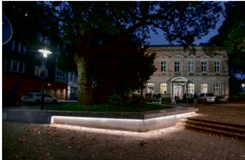
Ein Teil der Aufwertung der Neusser Innenstadt sind zum Beispiel die Leuchtbänke, wie hier vor der Alten Post.

Zur Stärkung der Innenstadt gehört das bestehende Projekt, den Durchgangsverkehr auf der Sebastianusstraße für den motorisierten Individualverkehr zu stoppen. Statt dessen bieten auf der Straße Outdoor-Module Möglichkeiten zum Verweilen. Auch greift mit einer zeitbegrenzten Vermietung von Ladenlokalen und Einzelhandelsflächen zu vergünstigten Konditionen, zum Beispiel für ausgewählte Pop-up-Stores, ein weiteres Mittel zur Steigerung der Attraktivität im Innenstadtbereich. Unweit davon erfährt der Meerer-