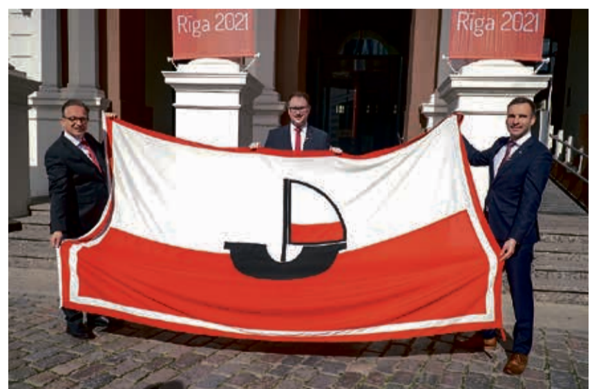
Die Übergabe an den Neusser Bürgermeister Reiner Breuer erfolgte vor dem Rathaus in Riga durch den Bürgermeister Mārtiņš Staķis (Rechts im Bild) und dem Lübecker Bürgermeister Jan Lindenau zugleich Vormann der Hanse.

Weitere Informationen rund um den 42. Internationalen Hansetag in Neuss finden Sie auf www.hansetag2022.com !