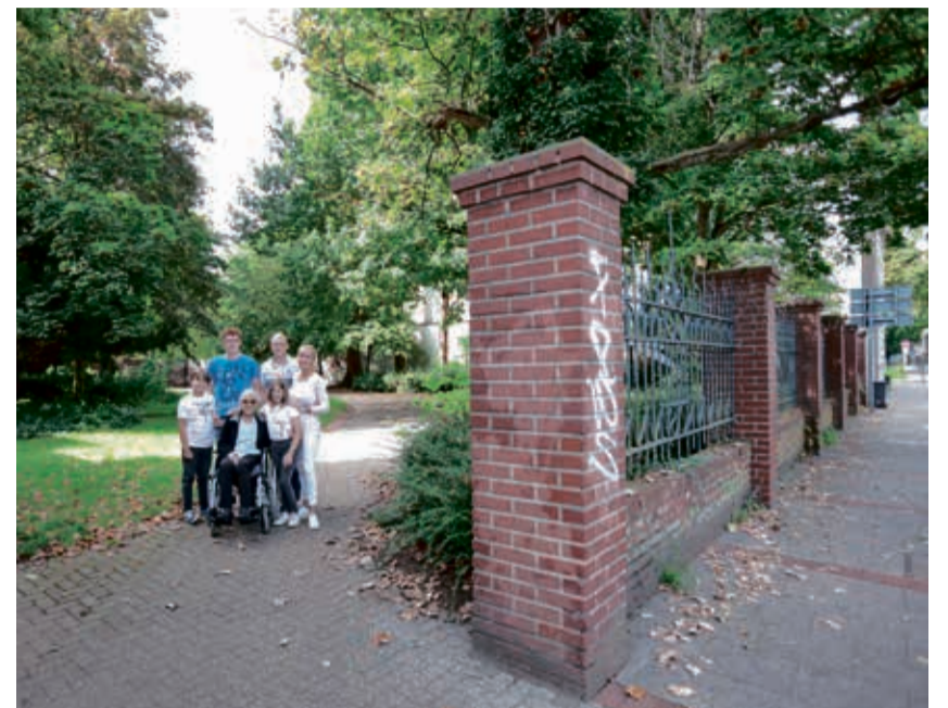
An der Augustinusstraße soll ein soziales Wohnprojekt realisiert werden.

Zu den Vorgaben, die in den Konzepten berücksichtigt werden müssen, gehört, dass der Wohnraum nahe des Obertors insbesondere Bürger*innen über 55 Jahren zur Verfügung stehen soll. Des Weiteren gehören Familien und Menschen mit Beein-