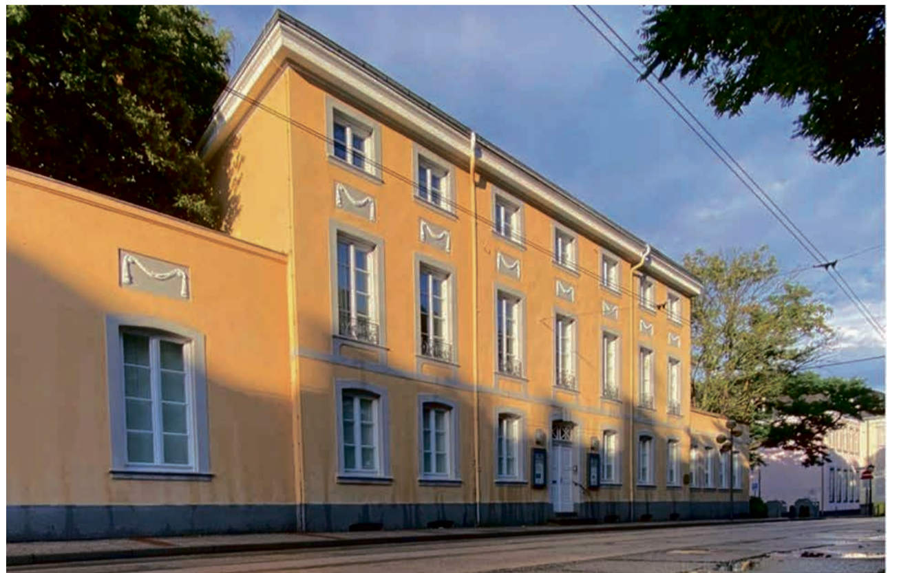
Zur Oberstraße hin wird das Stadtarchiv optisch nicht verändert, die Erweiterung wird zum Innenhof hin entstehen. Errichtet wurde das denkmalgeschützte Gebäude 1778 als Thurn- und Taxis'sche Post.

Die bauliche Erweiterung umfasst zwei Baukörper, die jeweils eingeschossig geplant sind. Ein Gebäude