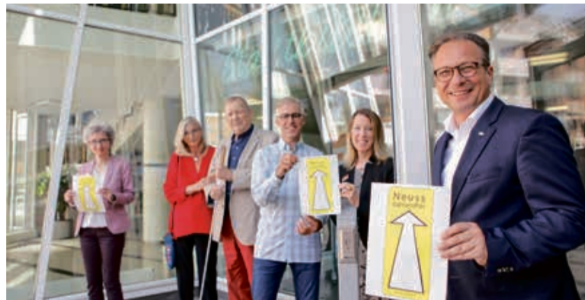
Die Neusser Stadtbibliothek ist die zweite Dienststelle, die das „Neuss barrierefrei“-Signet bekommen hat.

Im Oktober kann man gleich zu Monatsbeginn die Eröffnung des neuen „Makerspace“ miterleben. Dies ist ein neuer Bereich – dessen Wände übrigens von der Neusser Künstlerin Claudia Ehrentraut gestaltet wurden – in dem die verschiedensten Dinge kreativ umgesetzt und gestaltet werden, und das für verschiedene Altersgruppen. Am 2. Oktober wird ab 14 Uhr zum Beispiel das Basteln von Schnuffelkissen für Hunde und Katzen angeboten. Auf dem Programm steht zudem das Digitalisieren von analogen Tonträgern wie Kassetten oder Schallplatten, die schier unendlichen Möglichkeiten des 3D-Drucks und die Welt der kleinen und großen Roboter. Wer an der Eröffnung teilnehmen möchte, benötigt keinen gültigen Bibliotheksausweis, eine Anmeldung zu den Workshops ist aber erwünscht. Auch das geht ganz leicht auf www.stadtbibliothek-neuss.de . Einfach auf den Programmpunkt klicken, seine Angaben in die Felder eintragen, abschicken und fertig. Entsprechend geht man auch bei einer Anmeldung für eine der anderen Veranstaltungen vor.