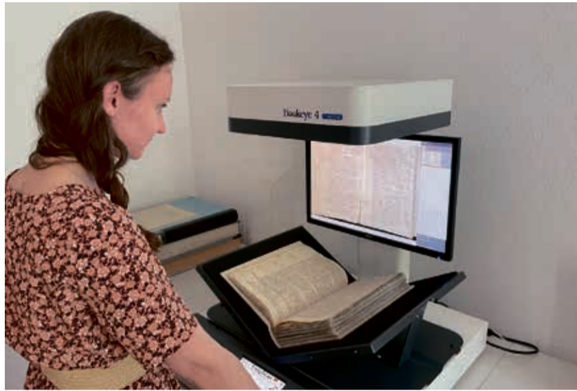
Mit Hilfe des modernen Buchscanners lassen sich die historischen Ratsprotokolle im Stadtarchiv schonend und rationell digitalisieren.

Nach dem Scannen der Ratsprotokolle werden diese ebenfalls