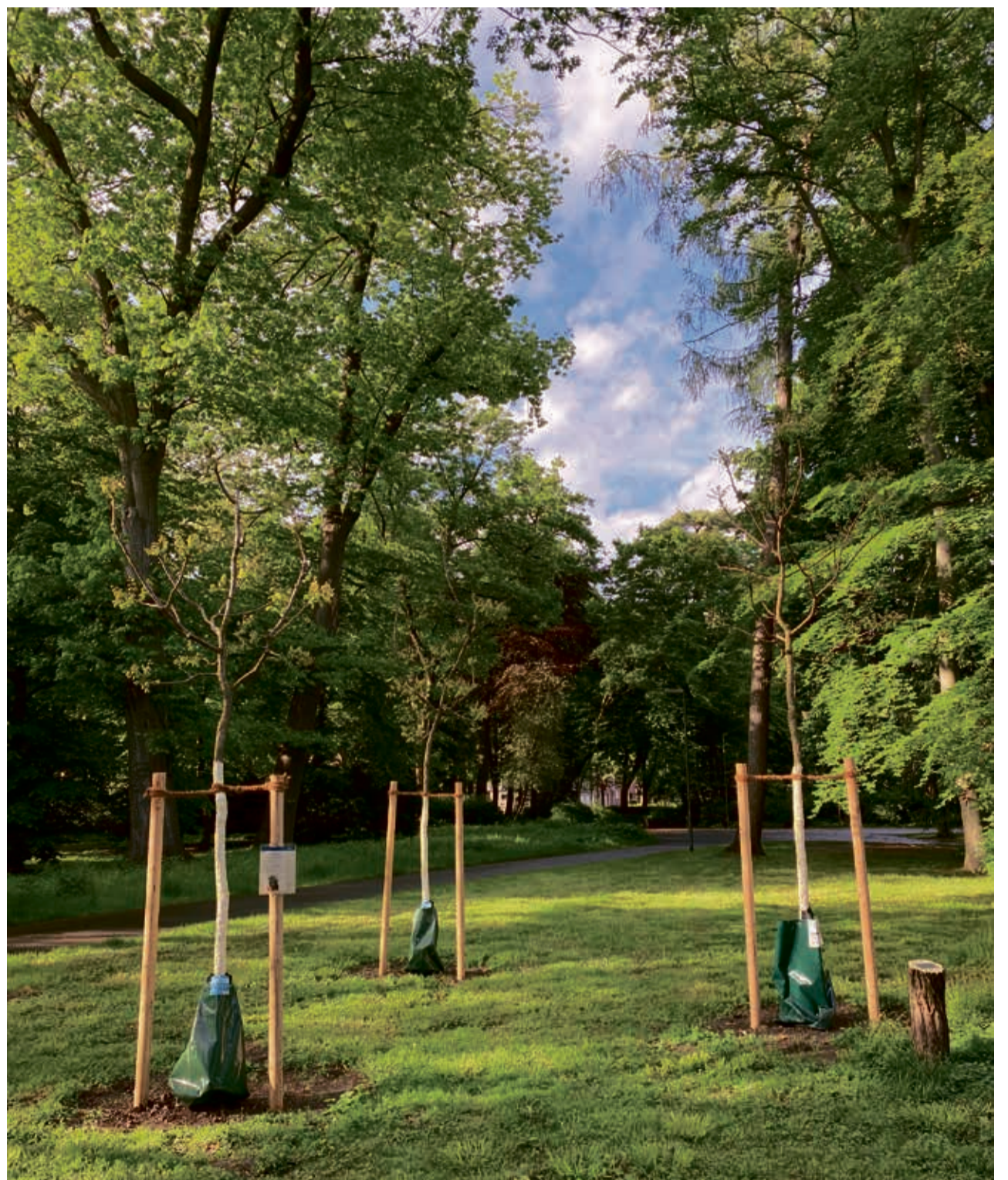
Bei den Neupflanzungen, die abgestorbene oder kranke Bäume ersetzen, wird bei der Auswahl auf Anpassung an den Klimawandel und ökologischen Nutzen geachtet.

Baumspenden oder -patenschaften, Hochzeitsbäume oder Kooperationen zur Wiederaufforstung von geschädigten Waldflächen: Die Möglichkeiten für Bürger*innen oder Unternehmen, sich für den Baumbestand in Neuss einzusetzen, sind vielfältig. Viele Privatpersonen und Betriebe haben sich schon dafür engagiert, weitere Baumpflanzungen zu ermöglichen. Wer sich dafür interessiert, kann sich telefonisch unter 02131 - 90 33 27 oder per E-Mail an ralf.herrmann@stadt.neuss.de mit dem Amt für Stadtgrün, Umwelt und Klima in Verbindung setzen.